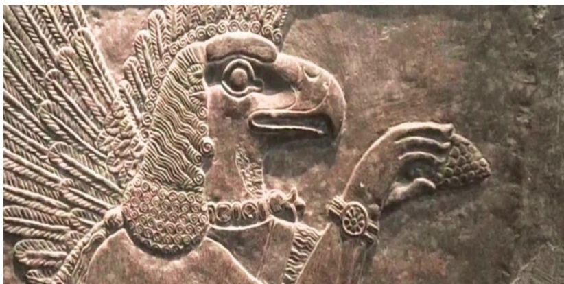
Annunaki - Darstellung auf sumerischen Schrifttafeln

Sie verbreiteten ihre Blutlinie auf der ganzen Welt, verschwanden und tauchten unter anderen Namen überall auf der Erde wieder auf. Ihr Blut weist einen sehr hohen Kupferanteil auf, weshalb es eine blaue Farbe hat. Daher hat auch der Ausdruck "königlich blaues Blut" oder "die Blaublütigen" seinen Ursprung.