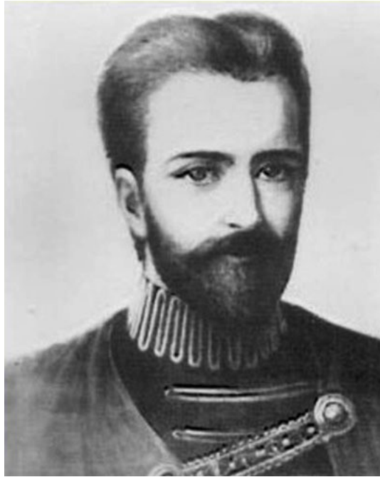
Comte de Saint Germain

Um 1727 teilte er seine geheimen Geldmachttechniken mit einigen deutschen Bankiers in der Hoffnung, dass sie das Geld nutzen würden, um der Menschheit zu helfen.