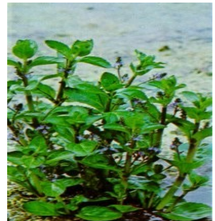
Bachbunge - Veronica beccabunga