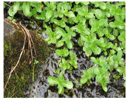
Bachbunge - Veronica beccabunga