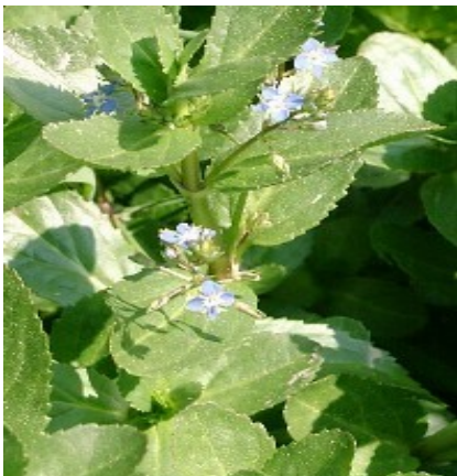
Bachbunge - Veronica beccabunga