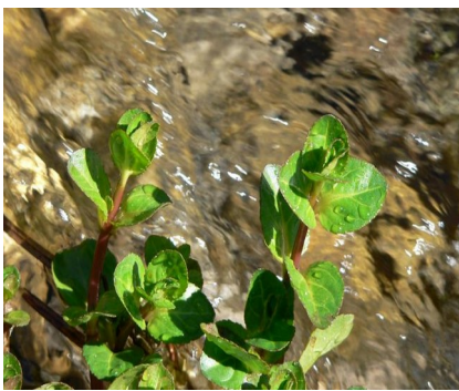
Bachbunge - Veronica beccabunga