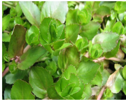
Bachbunge - Veronica beccabunga