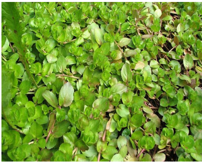
Bachbunge - Veronica beccabunga