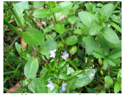
Bachbunge - Veronica beccabunga