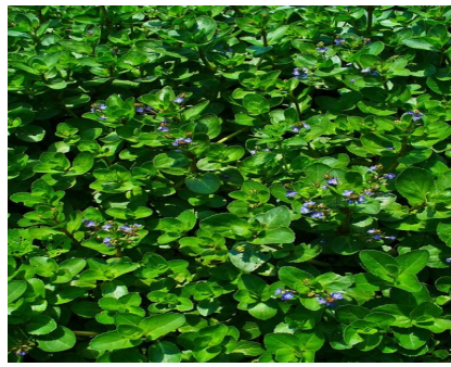
Bachbunge - Veronica beccabunga