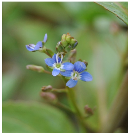
Bachbunge - Veronica beccabunga