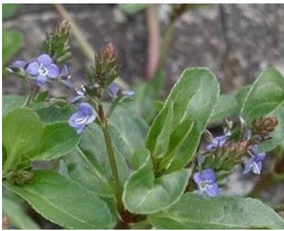
Bachbunge - Veronica beccabunga