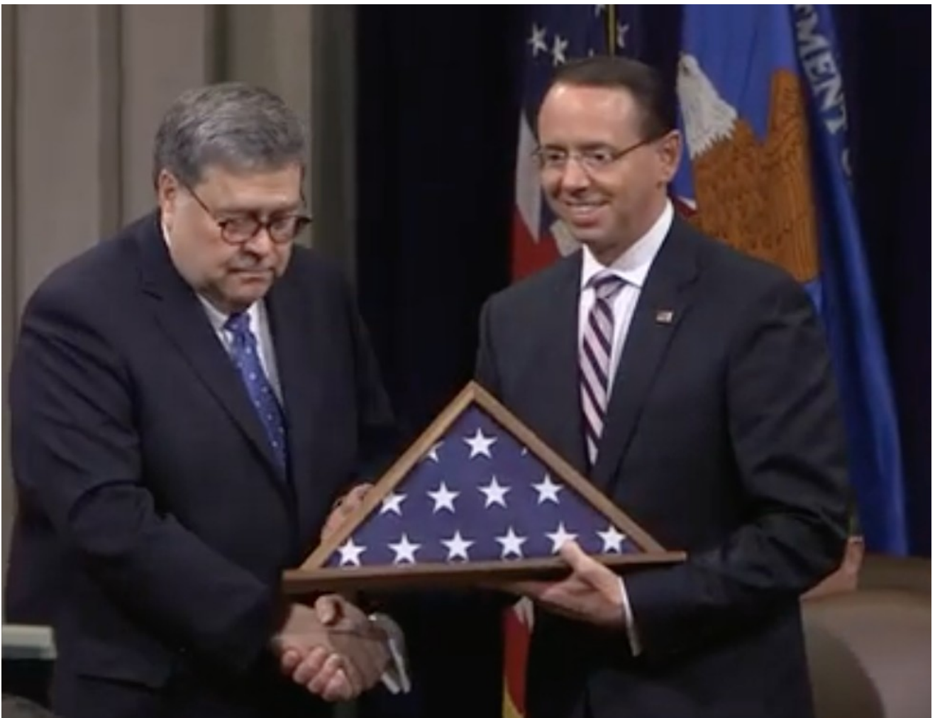
Rod Rosenstein bekommt die Flagge zum Abschied

Rosenstein selbst durfte sich am Ende bedanken und bekam eine zu einem Dreieck gefaltete amerikanische Flagge als Abschiedsgeschenk überreicht. Die wehte einmal über dem Justizministerium. So ist das Tradition.