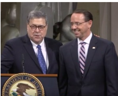
Barr und Rosenstein bei dessen Verabschiedung

Nachdem einige Kollegen aus den Abteilungen des Justizministeriums gesprochen haben, war der mit weniger Ehren verabschiedete ehemalige Justizminister Jeff Sessions einer der ersten, der sich sichtlich freute, dass Rosenstein mit ihm einst im Team war. Nachdem er selbst sich bezüglich Russland für befangen erklärt hatte, habe Rod Rosenstein für einige Dinge die Position des Justizministers innegehabt, nämlich zum Beispiel die Supervision über den Sonderermittler, den er dann auch selbst einstellen durfte. Rosenstein und Mueller kannten sich schon lange, daran wurde gleich noch einmal erinnert.